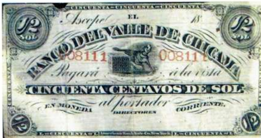
Valle de Chicama