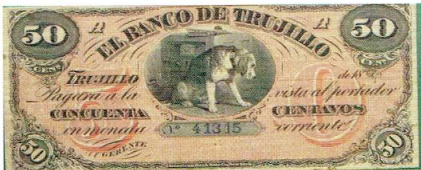
Banco de Trujillo