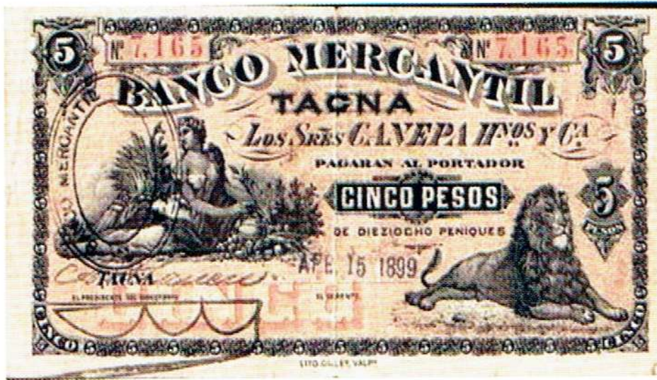
Banco de Tacna, cuya fortaleza y solidez esta Simbolizada por el león